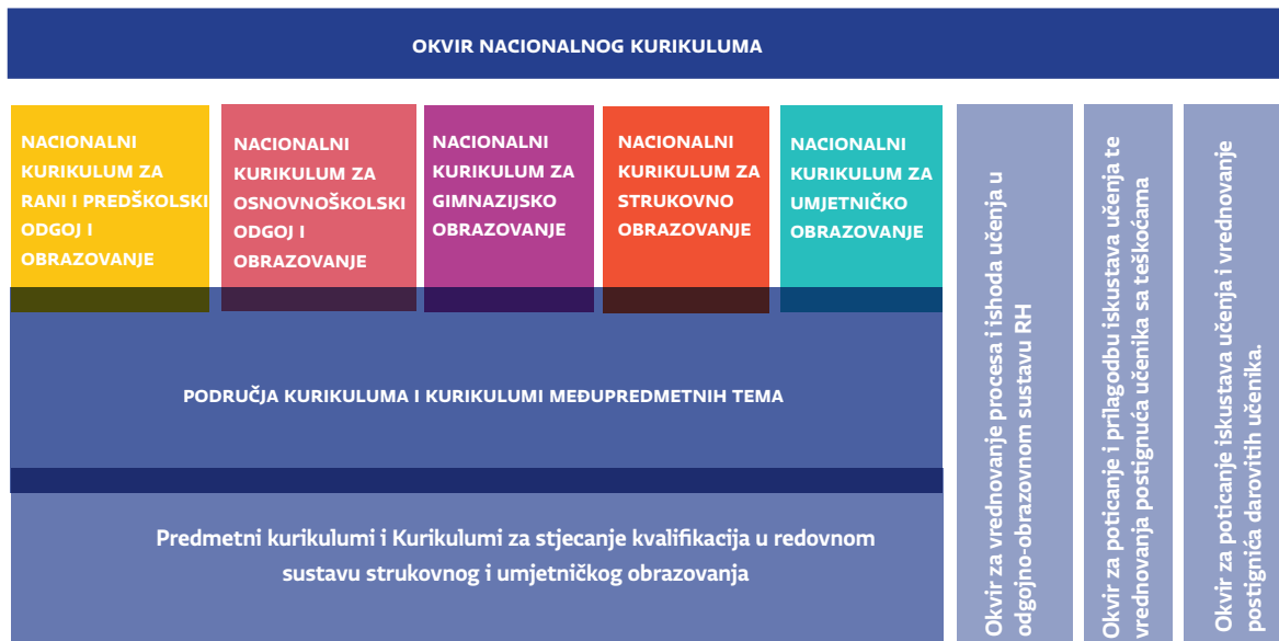
Slika 1. Sustav nacionalnih kurikulumskih dokumenata izrađenih u okviru Cjelovite kurikularne reforme

Sustav nacionalnih kurikulumskih dokumenata prikazan je na Slici 1.