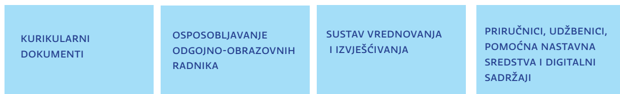
Slika A. Elementi Cjelovite kurikularne reforme

Cjelovita kurikularna reforma osmišljena je sveobuhvatno, odnosi se na sve razine i vrste odgoja i obrazovanja i usmjerena je na sljedeća četiri jednakovrijedna elementa (Slika A.):