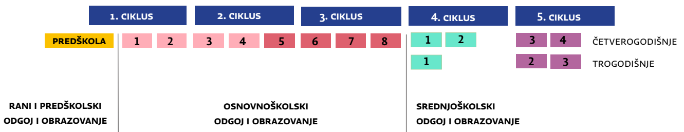
Slika 3. Odgojno-obrazovni ciklusi u postojećoj strukturi do visokoškolskoga odgoja i obrazovanja

Okvir nacionalnoga kurikuluma određuje rani i predškolski sustav odgoja i obrazovanja kao cjelovit odgojno-obrazovni ciklus i pet odgojno-obrazovnih ciklusa u osnovnoškolskome i srednjoškolskome odgoju i obrazovanju koji obuhvaćaju razdoblje od predškole do svih vrsta srednjoškolskoga obrazovanja kako za postojeću strukturu odgoja i obrazovanja (predškola + osmogodišnja osnovna škola + postojeće trajanje srednje škole (1+ 8 + 3/4)) tako i za onu predviđenu strukturnim promjenama iskazanim u Strategiji obrazovanja, znanosti i tehnologije (devetogodišnja osnovna škole i postojeće trajanje srednje škole (9 + 3/4)).