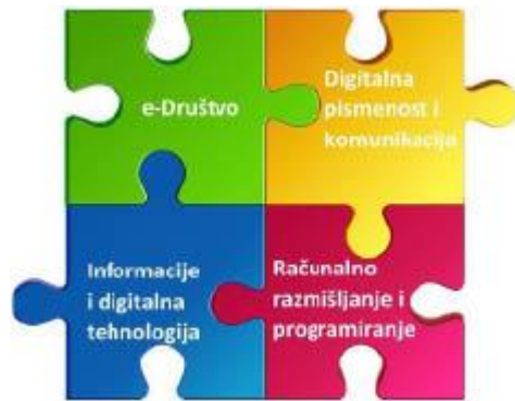
Slika 1. Povezanost domena

Domene se međusobno isprepliću i dopunjuju tako da pojedine sadržaje možemo razmatrati u više domena (1. slika). Primjerice, temeljne koncepte rada računala ili mrežnih uređaja razmatramo u domeni Informacije i digitalna tehnologija, ali i u domeni Digitalna pismenost i komunikacija u kojoj je neophodno poznavanje mogućnosti uređaja kako bismo mogli odabrati prikladno rješenje za određeni zadatak ili problem.