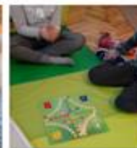
Slika 2. „Čovječe ne ljuti se“