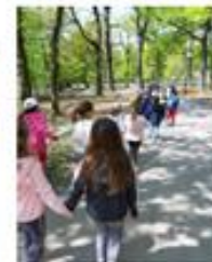
Slika 4. Šetnja u prirodi