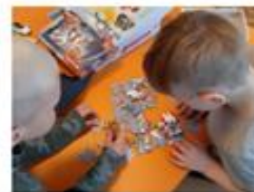
Slika 1. Slaganje puzzli