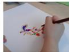
Slika 3. Mime aktivnosti (crtanje)